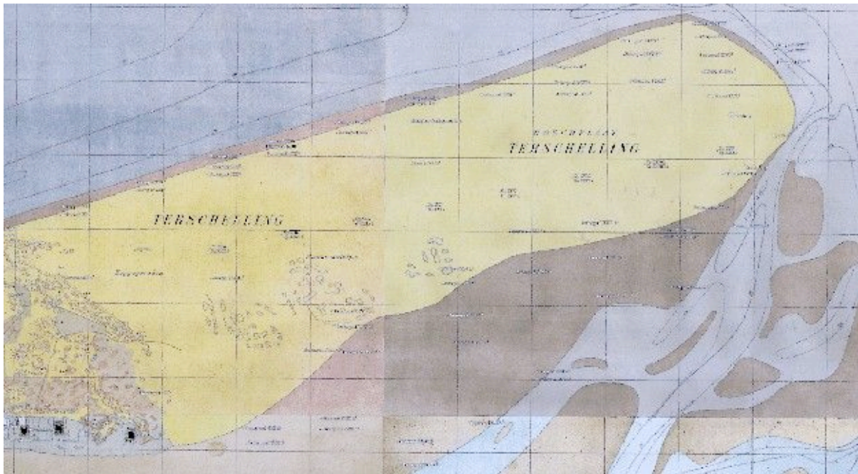
De Boschplaat rond 1900.

Terschelling is het grootste Friese waddeneiland. De sterke zeestroming in dit dynamische kustgebied, met als gevolg afslag en aangroei van het eiland, is van grote invloed geweest op de vorming van het eiland. Terschelling heeft net als Schiermonnikoog en Ameland een langgerekte, naar het oosten versmallende vorm met in de beschutting van de duinen diverse dorpen. Verder heeft het een ingepolderde kwelder, haakvormige zandplaten aan de westzijde en aan de oostzijde een uitgestrekt duin- en kweldergebied. Een groot deel van de vroegere kweldergronden is door een dijk tegen overstromingen vanuit de Waddenzee beschermd, maar Terschelling heeft ook een groot gebied dat onbedijkt is, de Boschplaat, dat bij hoog water onderloopt.