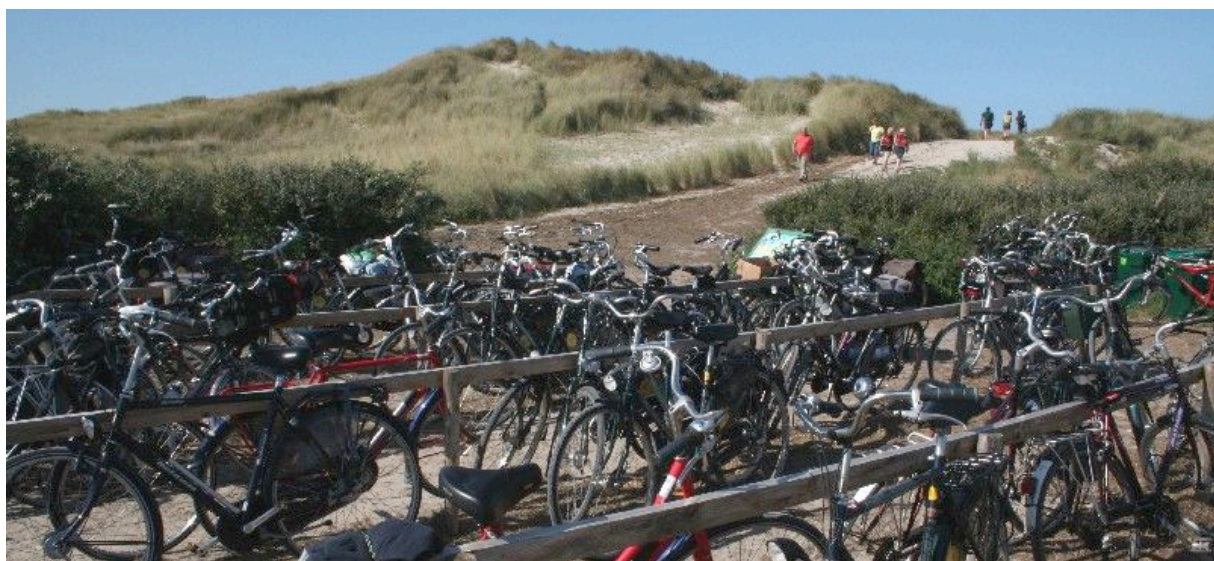
Veel toeristen nemen de fiets om het eiland te verkennen.

Terschelling is een populair vakantie-eiland, dat wordt bezocht door een grote diversiteit aan gasten. Er komen gezinnen, ouderen, vriendengroepen, rust- en natuurzoekers, jongeren en theaterliefhebbers.