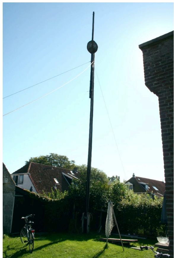
De sjuw (tijdbal) werd vroeger op bepaalde tijden gehesen en neergelaten als tijdsaanduiding voor werkers in het veld.