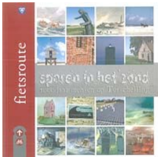
Fietsrouteboekje "Sporen in het zand"