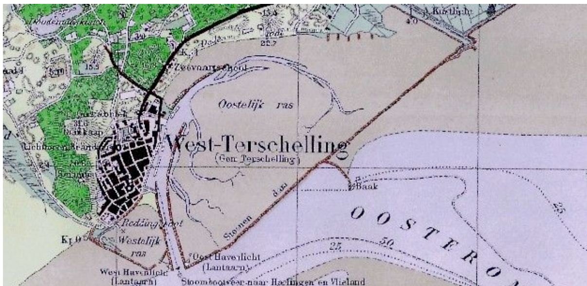
De haven van West-Terschelling rond 1900 (bron: Bonnekaart, KICH).

Lange tijd vormde de landbouw een belangrijke, maar smalle bestaansbasis van de eilandbevolking. Er werden echter ook andere manieren gezocht om inkomen te verwerven. Al sinds de Vikingen- en Hanzetijd ligt het waddengebied op de belangrijkste handelsroutes van Scandinavië en de Oostzee naar Holland, Vlaanderen en Engeland. Toen het zwaartepunt van de handel rond de Zuiderzee zich van de oostkust naar de westkust verplaatste, kwamen steden als Hoorn en Amsterdam op. Van deze verplaatsing profiteerde West-Terschelling, omdat de scheepvaartroute naar de Noordzee via het Vlie verliep.