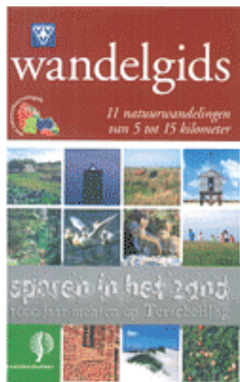
Wandelgids "Sporen in het zand"