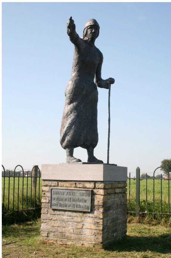
Het Stryper Wyfke.

Door zijn strategische ligging raakte het eiland betrokken bij vele oorlogen. Hierbij zijn dorpen en schepen meermaals in brand gestoken of geschoten. De meest dramatische was de brand in 1666 tijdens de Tweede Engelse oorlog, die West-Terschelling geheel in de as legde. Een mooie legende is uit deze periode overgeleverd. Het Stryper Wyfke, een oud vrouwtje uit de omgeving van Midsland, weet een compagnie Engelse soldaten af te schrikken door - wijzend naar de begraafplaats in de verte - de uitspraak te doen: "Er staan er bij honderden en er liggen er bij duizenden". Hoewel doelend op de doden en hun grafstenen, meenden de Engelsen dat er versterking was gekomen. Met haar uitspraak redde het Stryper Wyfke de overige dorpen en buurtschappen van het brandschatten. De historie van het eiland bestaat uiteraard uit veel meer dan wat zichtbaar is. Uit de overlevering zijn veel scheepsrampen bekend, waarvan de verhalen bewaard zijn gebleven, zoals die rond het schip de 'Lutine' dat vol met kostbaarheden ten onder ging. Om het maar niet over juttersverhalen te hebben. Ook heeft het eiland beroemdheden voortgebracht, zoals de ontdekkingsreiziger en poolvaarder Willem Barentsz.