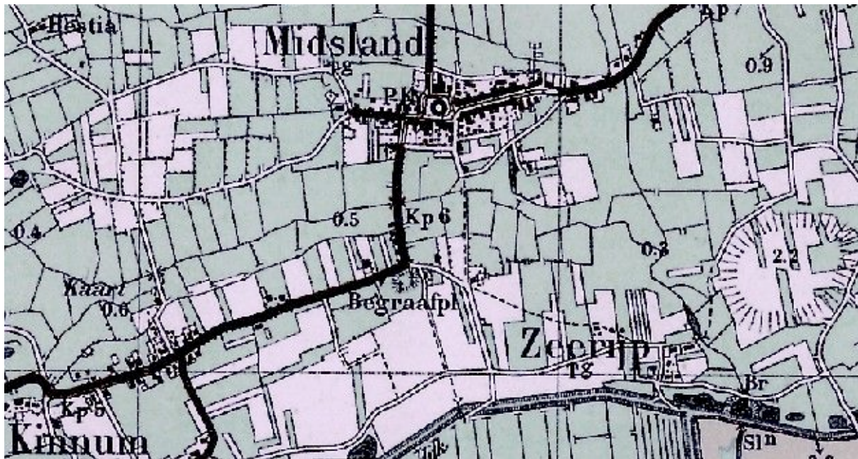
Midsland, Kinnum, Seerijp en het Stryper kerkhof rond 1900 (bron: Bonnekaart, KICH).

Het boerenbedrijf op Terschelling was vooral gericht op de veehouderij. Bijzonder op Terschelling zijn de boerderijen, gebouwd tussen 1850 en 1930, die zowel in vorm als indeling uniek zijn. Het gaat om een kop-romp type, met als karakteristiek element een dwars uitspringend zadeldak, het schúntsje genaamd. Een bijzonder cultuurgewas is de teelt van cranberries. In de 19 de eeuw zijn cranberries bij toeval aangespoeld en bleken al spoedig massaal te groeien in de vochtige duinvalleien. Het gewas vraagt weinig onderhoud en de vruchten worden gebruikt in tal van specifieke Terschellinger producten, zoals cranberrywijn en -jam.