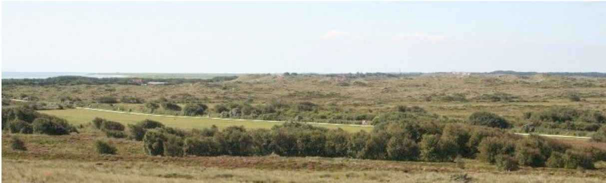
Witte fietspaden doorkruisen het landschap van Terschelling.

Zand' en is 35 á 40 kilometer lang. De route wordt aangeboden in vier trajecten die in beide richtingen zijn te volgen. Zo zijn er startpunten op het hele eiland en is er de mogelijkheid de route over meerdere dagen uit te splitsen. Op plaatsen waar dat wenselijk was zijn informatiepanelen opgesteld om elementen of verhalen toe te lichten. De markering en bebording is in een herkenbare stijl uitgevoerd; gekozen is voor de vorm van een eilander stoepaal. Op deze manier ondersteunt de markering de identiteit van het Terschellinger landschap. Bij de route is een begeleidend boekje verschenen waarin uitgebreide achtergrondinformatie en een kaart te vinden is.