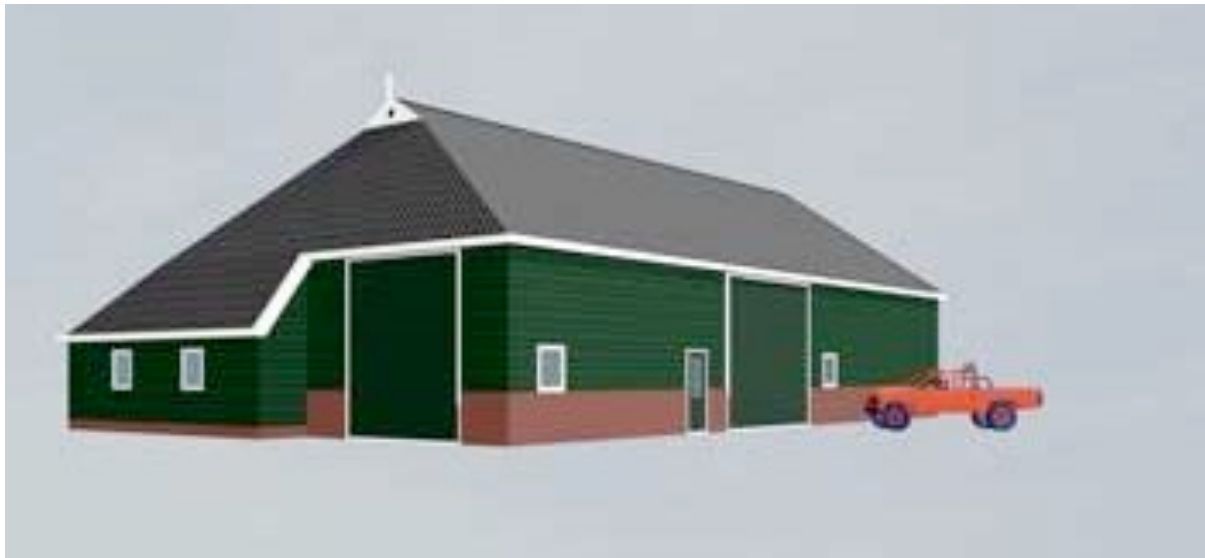
Ontwerp van een werktuigenschuur (bron: www.hoogeland.org ).

Het project Agrarisch Landschappelijk Bouwen heeft geleid tot het ontwerp van een streekeigen standardschuur, die voor zes concrete locaties is uitgewerkt, in nauw overleg tussen architect en boer. Er zijn drie schuren gerealiseerd. Op één van de locaties is tevens een expositieruimte ingericht.