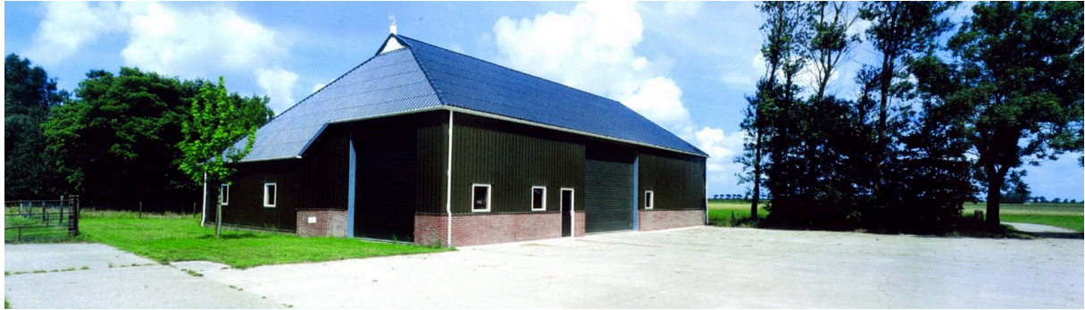
Werktuigenschuur bij de familie Rietema in Pieterburen.