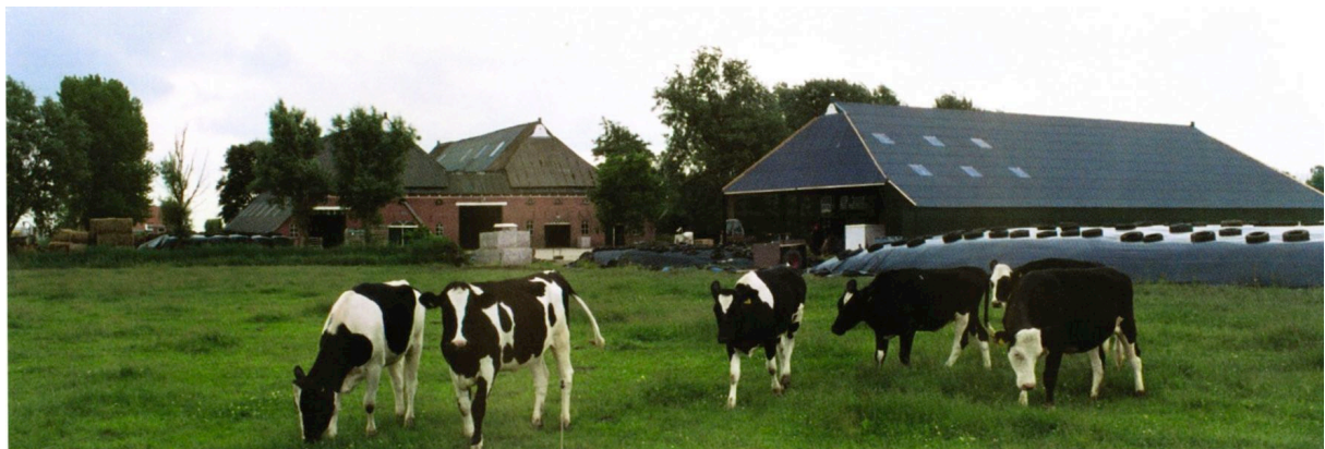
Open veeschuur bij Timmer te Stedum.

De resultaten van het project zijn opgenomen in het boek "Agrarisch Landschappelijk Bouwen in het "Wierde & Dijk" landschap; Bouwen met het landschap als uitgangspunt". Het boek is een rijk geïllustreerd 'praktijkboek'. Aan de hand van veel foto's en tekeningen wordt uiteengezet hoe in de moderne tijd aansluiting kan worden gezocht bij het beeld van de traditionele schuren.