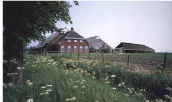
aangepaste studievorm.

Bij het ontwikkelen van eigentijdse streekeigen architectuur gaat het erom specifieke, streekeigen kenmerken uit het verleden te benutten voor nieuwe ontwerpen van woningen, stallen, schuren of bijgebouwen. Heel vaak wordt immers gekozen voor een (goedkoop) standaardontwerp uit een catalogus, dat meer het resultaat is van de mode en tijdgeest, dan een product dat in zijn omgeving past. De Nederlandse regio's gaan daardoor steeds meer op elkaar lijken. Vaak kan met kleine details al veel worden bereikt. Denk aan het aanbrengen van luiken, het kleur- en materiaalgebruik (van baksteen en houtwerk), de geveloriëntatie of de positionering van bijgebouwen ten opzichte van het hoofdgebouw. Ook de erfbeplanting speelt een belangrijke rol. De windsingels rond de statige herenboerderijen in het weidse Groninger land bepalen voor een groot deel het karakter van de streek.