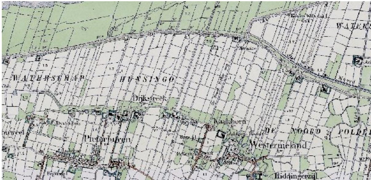
Pieterburen en Westernieland rond 1900.

In het huidige landschap worden de oude kerngebieden, zoals Middag, Humsterland en het zuidelijke deel van de Marne, gekenmerkt door een relatieve kleinschaligheid, met kleine wierdedorpen en weilanden met een onregelmatige percelering. Tal van laagten geven het verloop van oude geulen aan. Naar het noorden toe wordt de inrichting van het land steeds regelmatig. Er is al een duidelijk verschil tussen de kerngebieden en de kwelderwal van Pieterburen en Westernieland, dat vooral in de percelering tot uitdrukking komt. Nog regelmatig zijn de polders die de laatste eeuwen op de zee zijn veroverd, en die als schillen aan het oude land zijn toegevoegd. Vooral waar de dijken behouden zijn gebleven is een uiterst karakteristiek landschap ontstaan dat sterk contrasteert met het achterliggende wierdenlandschap.