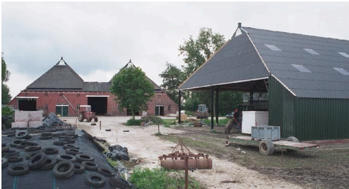
Multifunctionele schuur bij maatschap Wiersema te Godlinze.