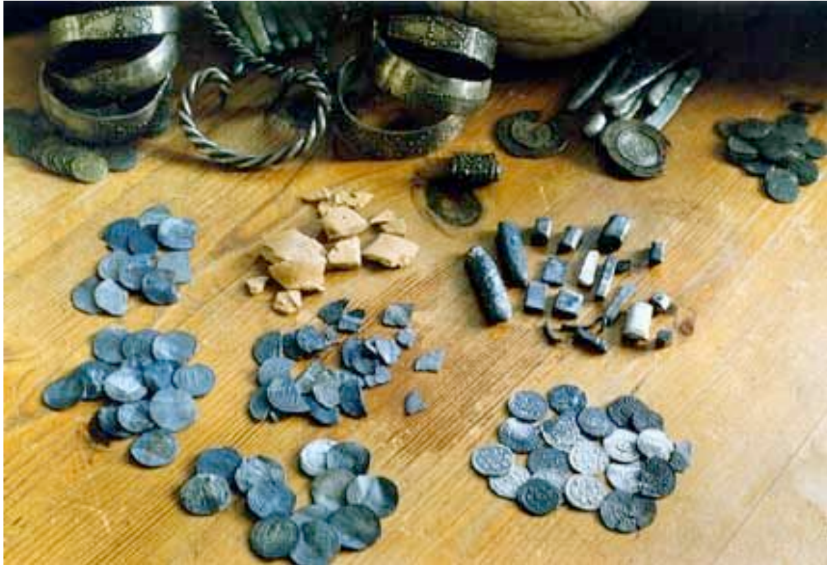
De schat van Westerklief.