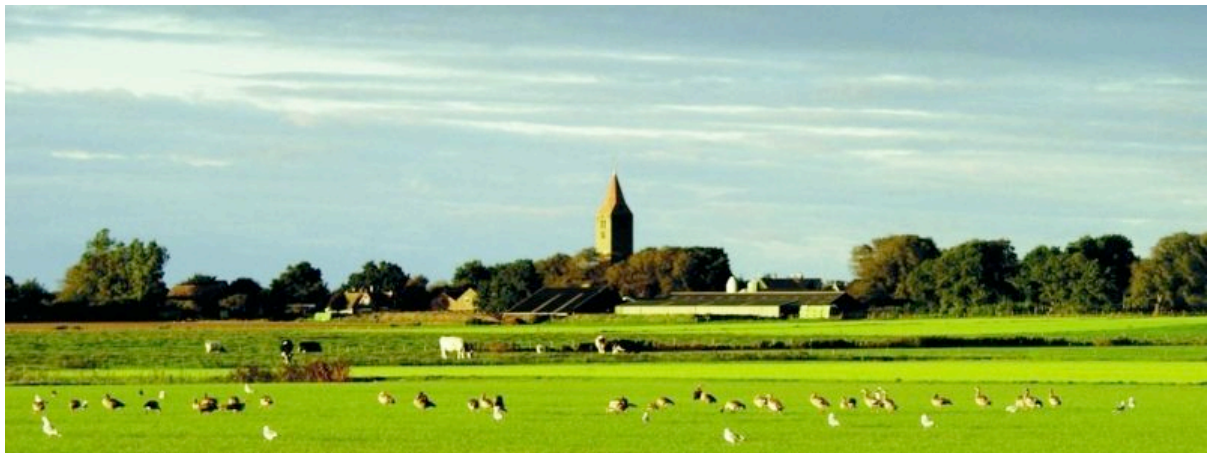
Gezicht op Oosterland met de Michaelskerk.

De werkgelegenheid in de Kop van Noord-Holland staat onder druk. Een belangrijke oorzaak is gelegen in de kwetsbare economie van het gebied. Het verminderen van defensieactiviteiten, het teruglopen van de offshore-industrie en de agrarische sector en de voortgaande quotering in de visserij dragen alle bij aan een structurele vermindering van arbeidsplaatsen. Het openbaar lichaam Gewest Kop van Noord-Holland en de daarin deelnemende gemeenten werken samen met de provincie Noord-Holland en de rijksoverheid aan het verbeteren van de werkgelegenheid en het benutten van kansen. Bevordering van het toerisme vormt daarbij een van de speerpunten.