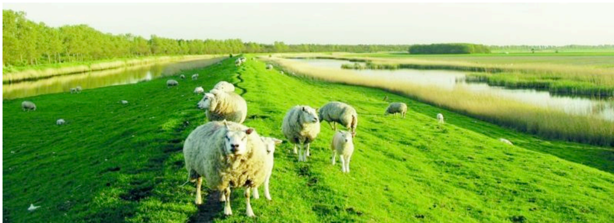
Op de grens van oud en nieuw land: Wieringen (rechts) en Wieringermeer.

Pas in de 12 e eeuw na Christus werd Wieringen een eiland. Met de aanleg van wierdijken – een zeewering bestaande uit dicht opeengestapeld wier, vastgezet in een houten constructie - werd de zuidkust van het eiland goed beschermd tegen de zee. Wieringen bleef een eiland tot 1928, toen de in dat jaar aangelegde Amsteldiepdijk het gebied met het vasteland van Noord-Holland verbond.