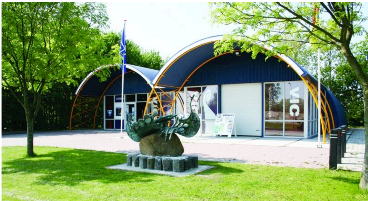
VIC Informatiecentrum Vikingen op Wieringen.

Met financiële bijdragen van de Europese Unie (LEADER+), de provincie Noord-Holland, het Regionaal Economisch Stimuleringsprogramma Kop en Munt, de gemeente Wieringen en de tomeloze inzet van vrijwilligers werd de belangrijkste doelstelling verwezenlijkt: aan de Havenweg 1 te Den Oever verrees het VIC Informatiecentrum Vikingen op Wieringen, dat op 7 juni 2004 zijn deuren voor het publiek opende. Vormgeving, kleurstelling en inrichting van het bezoekerscentrum zijn met ondersteuning van enkele externe adviseurs in eigen beheer ontwikkeld en uitgevoerd.