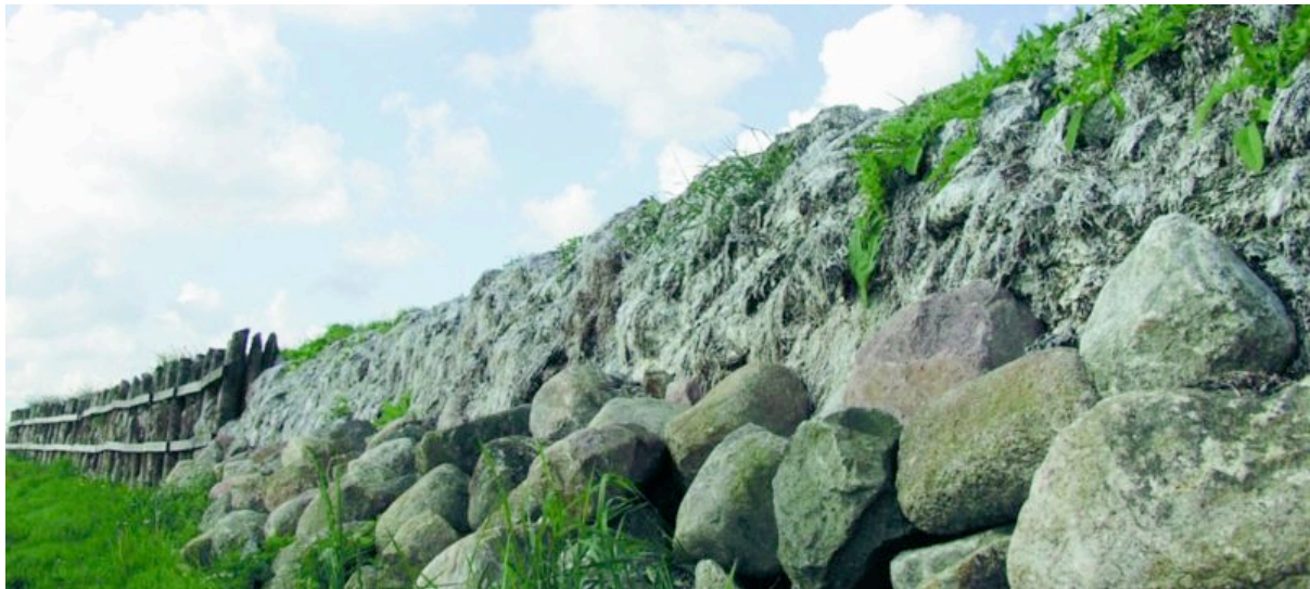
Reconstructie in situ van een deel van de wierdijk.

eiland Wieringen projecten opgenomen met het unieke landschap en het duurzaam gebruik van het erfgoed als basis.