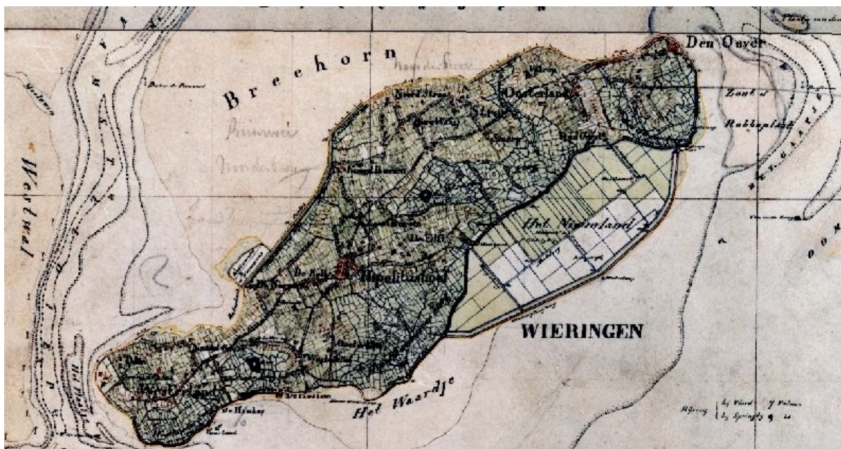
Wieringen rond 1850 (bron: Topographische en Militaire Kaart, Alterra).

In 1996 werd nabij het buurtschap Westerklijf een zilvervondst gedaan, bestaande uit diverse armbanden, drie fragmenten van muntsieraden met telkens een Arabische munt, Karolingische munten en zilverbaren. Uit wetenschappelijk onderzoek is vastgesteld, dat de eigenaar van deze voorwerpen een Deense Viking moet zijn geweest, die zijn handelsvoorraad rond het jaar 850 na Christus aan de Wieringer bodem toevertrouwde. Deze vondst en de toeschrijving waren landelijk voorpaginanieuws. De impact op de Wieringer bevolking was eveneens groot. Dat werd nog versterkt na de vondst van twee nieuwe zilverschatten in resp. 1999 en 2001. Uit nader onderzoek bleek dat deze twee schatten ooit een geheel vormden.