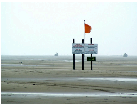
Vlieland: militair oefenterrein en recreatiewoningen

Handel en visserij waren, naast de scheepvaart en dubieuze activiteiten als strandjuten en smokkelen, belangrijke pijlers in de economie van het eiland. Anders dan op de overige eilanden ontbreekt op Vlieland de landbouw; er is geen geschikte landbouwgrond. Zoals gezegd was het maritieme bedrijf eeuwenlang de hoofdbron van bestaan. Na de opening van het Noordzeekanaal (1876) en de opkomst van de stoomvaart veranderde dat. Na een diepe crisis verschoof sinds de jaren '20 van de 20 ste eeuw het accent naar waar het nu ligt: het toerisme. Daarnaast biedt Defensie werk aan zo'n 20% van de huidige beroepsbevolking. In de Vianens Vallei op Vlieland ligt een eendenkooi, die bestaat uit een vijver, de kooiplas en één of meer vangpijpen. Het geheel wordt omgeven door een kooibos, een soort moerasbos voor rust op de plas en ter bescherming tegen de wind. In het duingebied vormt dit een groen contrast. Eendenkooien worden gebruikt om wilde eenden en andere eendachtigen te vangen. Het kooibedrijf heeft een duidelijke cultuurhistorische traditie en waarde. Het zijn zeldzame, oude landschapselementen waar rust en ruimte van groot belang zijn.