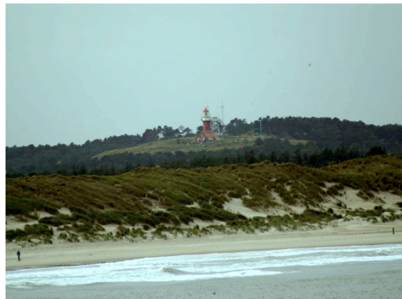
Het hoogste duin in het Nederlandse Waddenzeegebied: Vuurboetsduin

Vlieland wordt al in 1317 vermeld. Eeuwenlang bezat Vlieland twee dorpen, maar door afslag van land ging het dorp West-Vlieland in het begin van de 18 de eeuw ten onder. Een intensieve wisselwerking tussen de natuurkrachten en menselijk handelen vormden Vlieland. De mens maakte gebruik van de mogelijkheden die de processen van kustafslag en sedimentaanvoer boden. Bepanting hield stuivende duinen vast en waar de duingordel erg laag of smal was, versterkte de mens deze kustverdediging kunstmatig. Het eiland is vrijwel langs de gehele Noordzeekust onderhevig aan afslag en moet door hoofden (golfbrekers) beschermd worden. In de 17 de eeuw groeide het dorp Oost-Vlieland omdat veel schepen de rede van Vlieland opzochten om op goede wind te wachten. Vlieland had een belangrijke rol