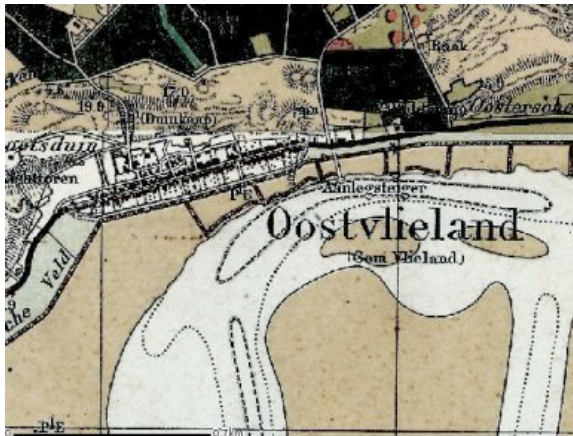
Het dorp Oost-Vlieland

bij het loodsen van deze schepen en bij de voedselvoorziening ervan. Ten behoeve van de scheepvaart is op het eiland een vuurtoren gebouwd. In het dorp staan enkele 17 de -eeuwse panden, waaronder het Tromphuis. Dit was vroeger in bezit van de Admiraliteit en is nu als museum ingericht.