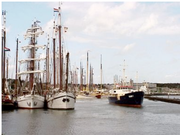
foto: De haven van West-Terschelling

Lange tijd vormde de landbouw een belangrijke, maar smalle bestaansbasis van de eilandbevolking. Er werden echter ook andere manieren gezocht om inkomen te verwerven. Al vanaf de Hanzetijd lag het Waddengebied op de belangrijkste handelsroutes. Toen het zwaartepunt van de handel rond de Zuiderzee zich van de oostkust naar de westkust verplaatste, kwamen steden als Hoorn en Amsterdam op. Van deze verplaatsing profiteerde West-Terschelling, omdat de scheepvaartroute naar de Noordzee via het Vlie verliep. Er vestigde zich zeevaarders en loodsen. Zo kreeg Terschelling, net als Vlieland een belangrijke functie bij het bevoorraden en loodsen van schepen en ontwikkelde, met name West-Terschelling, zich tot een havenplaats. De bloei die de plaats in de Gouden Eeuw kende is nog te zien in de karakteristieke commandeurswoningen, de huizen van de toenmalige scheepskapiteins. Nog in 1874 leverde Terschelling het grootste aantal zeelieden voor de Nederlandse koopvaardij. De nauwe betrekkingen die Terschelling onderhield met de handelsvaart en de visserij resulteerde in 1875 in de oprichting van de zeevaartschool Willem Barentsz. Mede hierdoor en door de centrale ligging van het eiland zijn er belangrijke nautische diensten op het eiland gevestigd, zoals de vaarwegmarkeringsdienst, de Kustwacht en de verkeerscentrale Brandaris, die ook de Centrale Meldpost Waddenzee is.