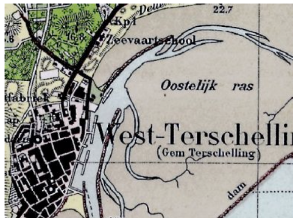
Ligging van de Willem Barentsz zeevaartschool

Extra inkomsten kwamen ook uit de eendenkooien die er op Terschelling zijn. In totaal staan er nog zeven op het eiland. Een eendenkooi bestaat uit een vijver, de kooiplas en één of meer vangpijpen. Het geheel wordt omgeven door een kooibos; een soort moerasbos voor rust op de plas en ter bescherming tegen de wind. Een eendenkooi kent het kooirecht, het recht om eenden te mogen vangen, en het afpalingsrecht, waarbinnen de rust niet mocht verstoord worden. De grootte van het gebied met afpalingsrecht varieert, ook de vorm en inrichting van de kooien vertonen verschillen. Er kunnen verschillende typen onderscheiden worden: het Noord-Hollandse, Texelse, Friese en het Terschellinger type. Beide laatste typen stonden model voor de kooien op de Duitse Waddeneilanden.