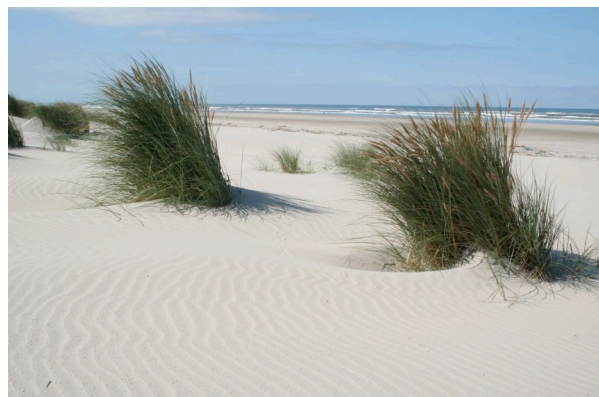
foto's: Schapenhouderij in de binnenduinstrand; kustverdediging aan de zeezijde

Aan het eind van de 19 de en begin van de 20 ste eeuw kwam de landbouw in beter vaarwater terecht. Door de introductie van kunstmest en de aankoop van veevoer werd de landbouw productiever. Hierdoor specialiseerde de landbouw op Terschelling zich steeds meer in de melkveehouderij. Uniek op Terschelling zijn de boerderijen, gebouwd tussen 1850 en 1930,