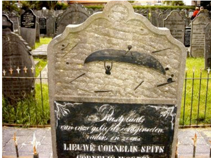
foto: Grafsteen op de begraafplaats aan de voet van de Brandaris

Op Terschelling zijn twee restanten van stinswieren te vinden, bij Oosterend en bij Lies. Beide zijn door Friese familie Popma gebouwd. De activiteiten van de Popma's op Oost-Terschelling, duiden op het belang van dit deel van het eiland in agrarisch-maritieme zin. Het boerenbedrijf op Terschelling was vooral gericht op de veehouderij. Daarnaast werden voor de eigen voedselvoorziening en die van het vee, ook groenten en granen verbouwd. De groenten en granen werden verbouwd rond de bebouwing op de zandruggen. Tussen de dorpenrij en de duinen lagen gebieden die men gebruikte als hooiland omdat het kwelwater uit de duinen hier bleef staan waardoor het een moerassig en venig gebied was. Deze hooilanden werden op Terschelling door elzensingels omgeven. De bomen werden vaak aan de vochtige slootkant geplant, zodat de kostbare landbouwgrond zo efficiënt mogelijk kon worden gebruikt.