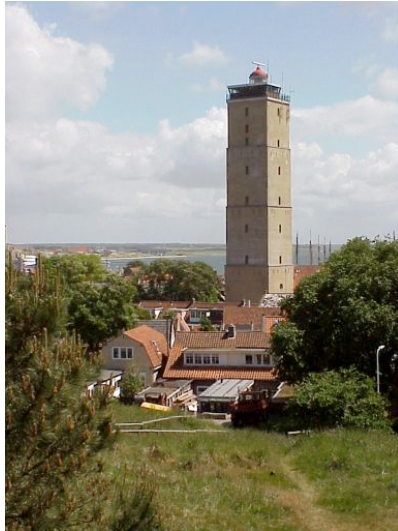
foto: De Brandaris uit 1594

hebben een meer open bebouwingsstructuur. Vooral West-Terschelling is cultuurhistorisch interessant door de vele oude huizen uit de 17 de eeuw en door de vuurtoren uit 1594, Brandaris genaamd, wat de oudste nog bestaande vuurtoren van Nederland is. De Brandaris is gebouwd op last van de Staten van Holland, toen de oude vuurbaak in zee verloren was gegaan. Bijzonder bij deze vuurtoren is het kerkhof gelegen aan de voet van de vuurtoren, waarbij tal van afbeeldingen en opschriften op de grafstenen verwijzen naar het maritieme verleden van de overledenen.