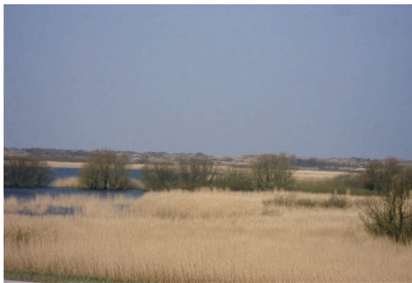
foto: Kwelder op Schiermonnikoog

Schiermonnikoog is een van de Friese waddeneilanden die, gelegen voor de kust van Nederland, een afscheiding vormen tussen de Waddenzee en de Noordzee. Het natuurlijke landschap ontstond door een stijging van de zeespiegel na de laatste ijstijd. Doordat uit de stijging van het zeewater ook verhoging van het zoete grondwaterpeil volgde, ontstond parallel aan de kust een zone waarin veen tot ontwikkeling kwam. De zee zette op deze veenlaag aan zeezijde klei en zand af, terwijl het veen aan de landzijde zich over de hoger gelegen zandgronden uitbreidde. Als gevolg van de doorbraak van het Nauw van Calais veranderde de zeestroming, die liep meer parallel aan de kust. Hierdoor ontstonden lage duinenreeksen, strandwallen genoemd, die - onderbroken door rivieren - in de zee uitmondten. Door latere inbraken van de zee werd achter de strandwallen veel veen weggeslagen en werden de strandwallen in kleinere stukken verdeeld: de waddeneilanden.