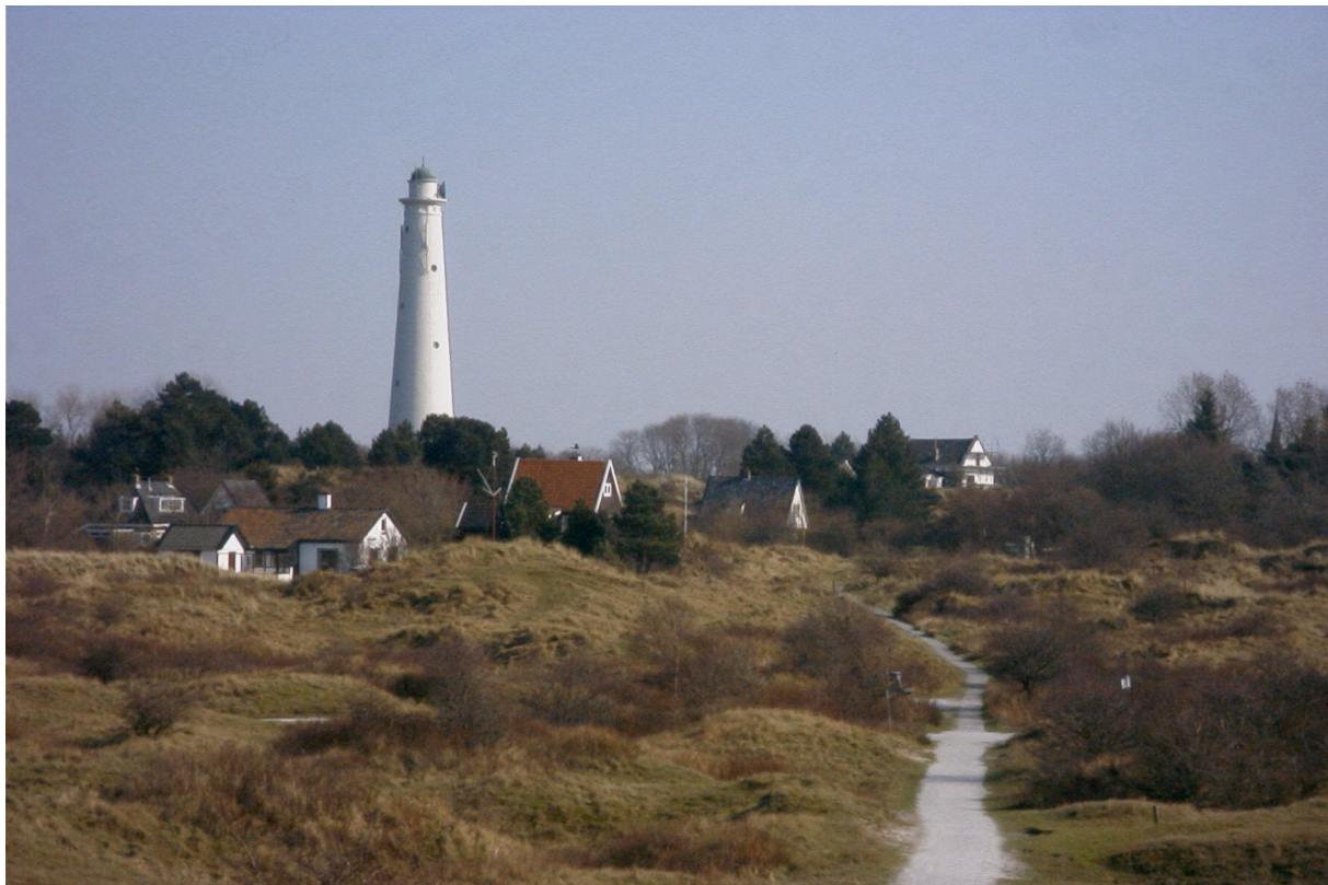
foto: Oude vuurtoren Schiermonnikoog

In de bij het dorp aansluitende kwelder liggen zes boerenbedrijven. Het boerenbedrijf op Schiermonnikoog was vooral gericht op de veehouderij, waarnaast voor de eigen voedselvoorziening en voor het vee ook groenten en granen werden verbouwd. Tussen de