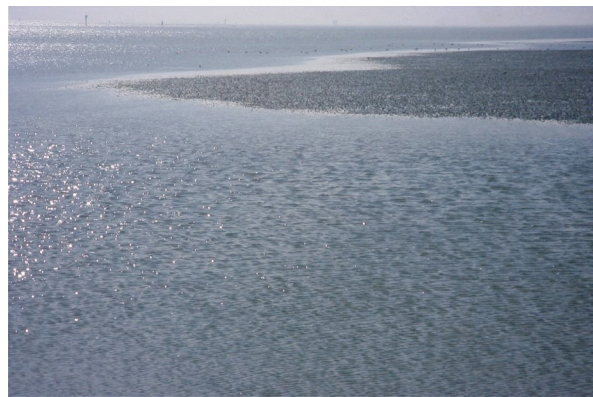
foto: het Wad

Schiermonnikoog draagt de sporen van zijn ligging in een dynamisch kustgebied, waar de afslag op de ene plaats en aangroei op de andere plaats van grote invloed is geweest bij het vormen van het eiland. Schiermonnikoog heeft net als de eilanden Terschelling en Ameland een langgerekte, naar het oosten smallere vorm, met in de beschutting van de duinen een dorp. Het heeft ook een ingepolderde kwelder, haakvormige zandplaten aan de westzijde en aan de oostzijde een uitgestrekt duin- en kweldergebied. Getracht wordt om grip te krijgen op het proces van aanwas en afslag, daar het eiland aan westzijde voortdurend van afslag te lijden heeft en daardoor een duidelijke tendens vertoont tot verschuiving in oostelijke richting.