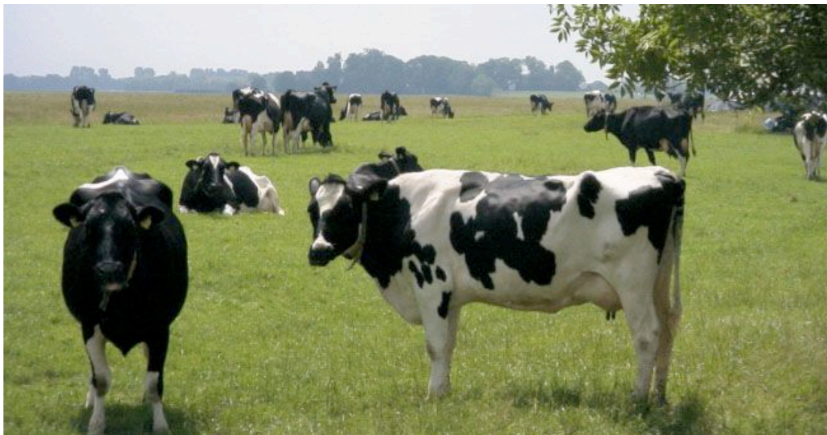
foto: Veehouderij in Middag-Humsterland

De kerstening had niet alleen de bouw van kerken tot gevolg. Er werden in de regio ook vier kloosters gesticht. Van de kloosters in Selwerd, Kloosterburen, Nijklooster en Aduard was het in 1192 gestichte cisterciënzerklooster Aduard het invloedrijkste. De monniken en lekebroeders van Aduard hielden zich bezig met het in cultuur brengen en de waterbeheersing van het omliggende gebied. Aangenomen wordt dat de monniken bijgedragen hebben aan de bedijkingen van Middag en Humsterland. Na een bedijking moest er zorg gedragen worden voor een goede afwatering. Voor de afvoer van het overtollige neerslagwater in Hunsingo werd het Aduarderdiep gegraven, waardoor het water via een uitwateringssluis op het Reitdiep kon worden geloosd. Een initiatief van de Aduarder monniken was de oprichting van zogenaamde zijlvesten: waterschapsorganisaties waarvan de abt in de veertiende en de vijftiende eeuw aan het hoofd stond.