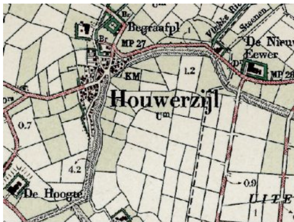
Kaart van het zijldorp Houwerzijl

Tot omstreeks het jaar 1000 hebben de bewoners van het wierdengebied de dreiging van overstromingen door het ophogen van de woonheuvels trachten te pareren. Nadien ging men dijken aanleggen om niet alleen de dorpen, maar ook het omringende landbouwgebied te behoeden voor overstroming door het zeewater. Behalve voordelen bracht de bedijking echter ook bezwaren met zich mee. Door de dijken werd het moeilijker het overtollige water af te voeren.