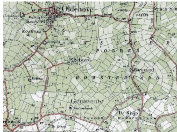
Kaart van Humsterland

De kerstening had niet alleen de bouw van kerken tot gevolg. Er werden in de regio ook vier kloosters gesticht. Van de kloosters in Selwerd, Kloosterburen, Nijklooster en Aduard was het in 1192 gestichte cisterciënzerklooster Aduard het invloedrijkste. De monniken en lekebroeders van Aduard hielden zich bezig met het in cultuur brengen en de waterbeheersing van het omliggende gebied. Aangenomen wordt dat de monniken bijgedragen hebben aan de bedijkingen van Middag en Humsterland. Na een bedijking moest er zorg gedragen worden voor een goede afwatering. Voor de afvoer van het overtollige neerslagwater in Hunsingo werd het Aduarderdiep gegraven, waardoor het water via een uitwateringssluis op het Reitdiep kon worden geloosd. Een initiatief van de Aduarder monniken was de oprichting van zogenaamde zijlvesten: waterschapsorganisaties waarvan de abt in de veertiende en de vijftiende eeuw aan het hoofd stond.