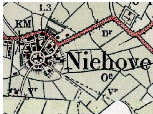
en van het wierdedorp Niehove

In Hunsingo begon de geschiedenis van de bedijking met de aanleg van ringdijken rondom de oude dorpen. De eerste dijken waren die rond de kerngebieden van Middag en Humsterland in de elfde of twaalfde eeuw. Ook het Marnegebied ten noorden van het Reitdiep heeft vermoedelijk zo'n ringdijk gehad. De oudste doorlopende zeeverende dijk langs de Noord-Groningse kust kwam omstreeks 1200 tot stand. Toen deze dijk werd aangelegd was de oorspronkelijke monding van de Hunze al geheel dichtgeslibd. De bedijkingen leidden tot nieuwe nederzettingen, die niet op een wierde lagen en hun ontstaan dankten aan de nabijheid van de dijk zelf, een afwateringssluis of een weg. Niet zelden werden de wegen aangelegd op de restanten van een oude dijk. Zijldorpen zijn Schouwerzijl, Houwerzijl, Munnikezijl, Kommerzijl, Lauwerzijl, Niezijl en Pieterzijl. Dijkdorpen in de regio zijn Den Andel, Den Ham, Kleine Huisjes, Kloosterburen, Molenrij, Pieterburen, Den Hoorn, Westernieland/Kaakhorn en Zuurdijk. In de loop van de Middeleeuwen is het bewoningspatroon tot stand gekomen dat ook het huidige landschap kenmerkt. Nadien zijn nog slechts enkele dorpen en buurtschappen ontstaan tengevolge van nieuwe inpolderingen. In de achtste eeuw werden de Ommelanden van Groningen gekerstend. Dit leidde in veel wierdedorpen tot de bouw van een kerk in het centrum, vaak op de plaats van de voormalige drinkwaterplaats, de dobbe. In een aantal gevallen werd rondom het kerkhof van de wierde