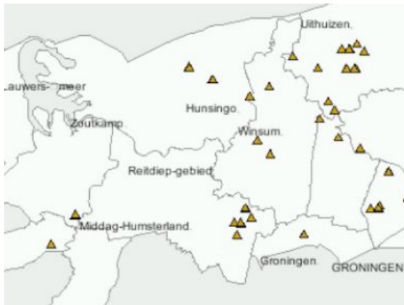
Kloosters in Noordwest Groningen

een kleine gracht gegraven ter vervanging van de dobbe. Overigens kon de dobbe pas worden gedempt als men op een andere manier aan voldoende zoet water kon komen. Dat betekent dat de bouw van de kerken en het verdwijnen van de dobben moet hebben plaatsgevonden na de bedijking, toen in de sloten voldoende zoet water beschikbaar was.