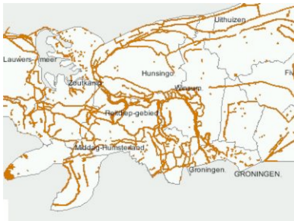
Dijken in het Reitdiepgebied