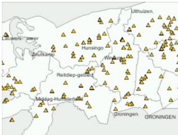
Kaart van borgen in Hunsingo

De belangrijkste waterweg in Hunsingo is het Reitdiep, waardoor de schippers vanuit Groningen naar zee konden varen. De meanders in de loop van de rivier waren lastig voor de scheepvaart. Om dit te verbeteren heeft men o.a. ten westen van Winsum (1629) en Sauwerd (1661) enkele forse meanders afgesneden. De oude bedding, het Oude Diepje, is als een slenk met een doorgaande brede sloot nog mooi in het landschap herkenbaar. Veel borgen zijn verdwenen, soms is het borgterrein nog in de vorm van grachten of beplanting zichtbaar. Soms ook staat er tegenwoordig een gelijknamige boerderij op de plaats van de verdwenen borg. Dit is bijvoorbeeld het geval bij de Aldringaheert bij Feerwerd en de Englumheerd en Jensema bij Oldehove. Nog bewaard gebleven borgen zijn Verhildersum bij Leens, Allersma bij Ezinge en Piloursema bij Den Ham .