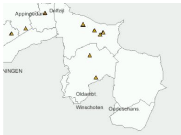
Kloosters in Oldambt