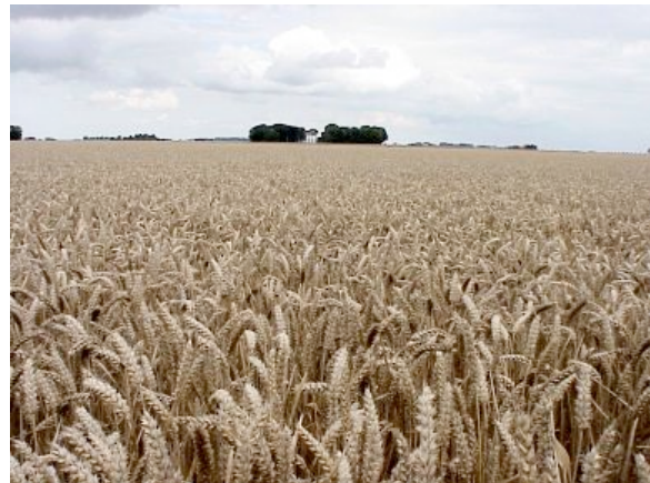
foto: Graanvelden in het Oldambt

De specialisatie in de akkerbouw had ook gevolgen voor de traditionele boerderijbouw: de akkerbouw vraagt een ander type boerderij dan de melkveehouderij. De Oldambtster boerderij verschilt dan ook nogal van de overige traditionele boerderijen in Groningen. In de 19 de eeuw werden verschillende boerderijen met een dwarshuis gebouwd en tenslotte zien we de ontwikkeling tot losstaande, villa-achtige woonhuizen. De status van de boerderij en zijn bewoners werd tot uitdrukking gebracht door het grote aantal ramen, een stoep en een aangelegde tuin. In een aantal gevallen werd een geheel nieuw voorhuis gebouwd in uiterst moderne stijl. Net als bij buitenplaatsen zijn ook hier fraaie tuinen aangelegd, die de welstand van de eigenaren duidelijk tot uitdrukking moesten brengen.