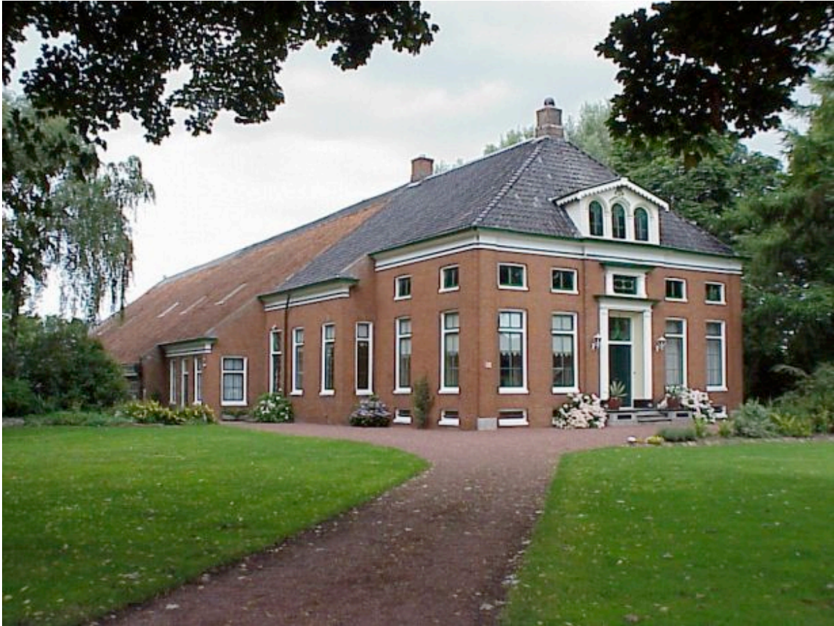
foto: Kenmerkende Oldambtster boerderij

Vroeger was de meest voorkomende vorm van percelering de opstreckende verkaveling vanaf de bewoningsassen. In de Dollardpolders kon van zuid naar noord een verandering worden geconstateerd van smalle, strookvormige percelering naar modern-rationele verkaveling. Deze kenmerken zijn door de ruilverkavelingen grotendeels verdwenen. Op veel plaatsen is zelfs een geheel andere kavelrichting aangebracht.