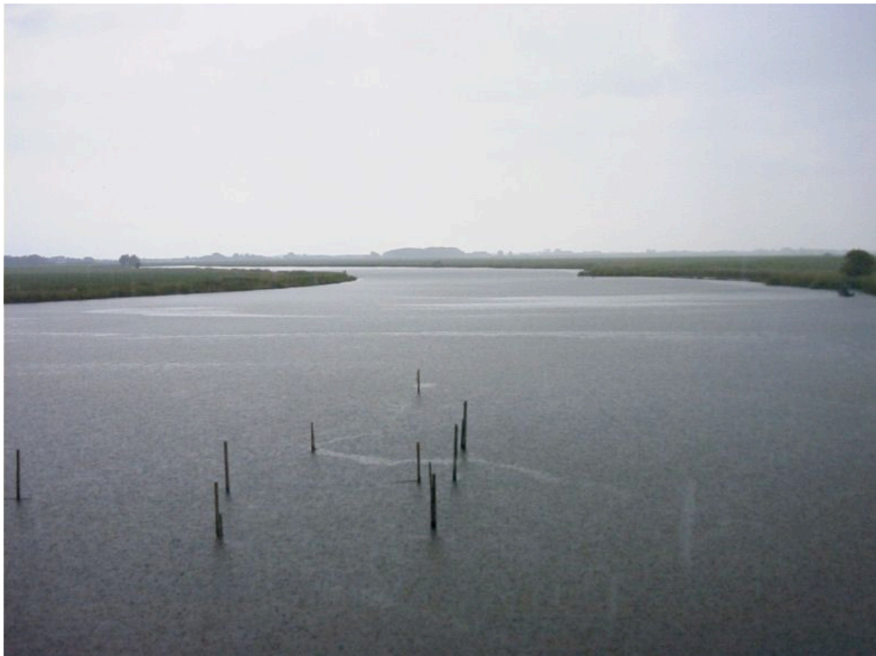
foto: Het Reitdiep

Vele rivieren mondden uit in de Lauwerszee. Bij Zoutkamp kwam het Reitdiep erin uit, bij Munnikezijl de Lauwers, bij Dokkumer Nieuwe Zijlen de Dokkumer Ee en bij Ennumazijl de Zuider Ee. Sinds de afdamming van het Reitdiep in 1877 zijn bij Zoutkamp sluizen gebouwd. Verder ligt in de afsluitdam van de Lauwerszee ook een uitgebreid sluizencomplex. Er liggen dus vele waterstaatkundige kunstwerken in het Lauwerszeegebied. Rond 1580 liet een Spaanse stadhouder een verbinding graven tussen Leeuwarden en Groningen, het kolonelsdiep, die in de 20 ste eeuw werd verbreed tot het Prinses Margrietkanaal. Halverwege de 17 de eeuw is de Stroobosser trekvaart gegraven tussen het Dokkumerdiep bij Dokkum en het Kolonelsdiep bij Stroobos. Het Dokkumerdiep was een van oudsher belangrijke scheepvaartroute. Tegenwoordig heet het, na het rechtekken van een aantal meanders en de aanleg van sluizen, het Dokkumer Grootdiep. De Stroobosser trekvaart en het Prinses