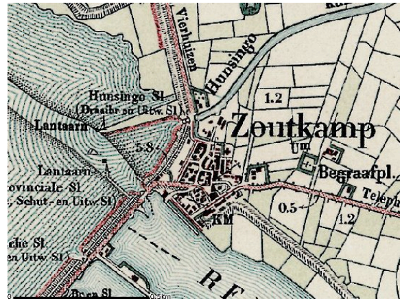
Schutsluizen en uitwateringssluizen bij Zoutkamp

Vele rivieren mondden uit in de Lauwerszee. Bij Zoutkamp kwam het Reitdiep erin uit, bij Munnikezijl de Lauwers, bij Dokkumer Nieuwe Zijlen de Dokkumer Ee en bij Ennumazijl de Zuider Ee. Sinds de afdamming van het Reitdiep in 1877 zijn bij Zoutkamp sluizen gebouwd. Verder ligt in de afsluitdam van de Lauwerszee ook een uitgebreid sluizencomplex. Er liggen dus vele waterstaatkundige kunstwerken in het Lauwerszeegebied. Rond 1580 liet een Spaanse stadhouder een verbinding graven tussen Leeuwarden en Groningen, het kolonelsdiep, die in de 20 ste eeuw werd verbreed tot het Prinses Margrietkanaal. Halverwege de 17 de eeuw is de Stroobosser trekvaart gegraven tussen het Dokkumerdiep bij Dokkum en het Kolonelsdiep bij Stroobos. Het Dokkumerdiep was een van oudsher belangrijke scheepvaartroute. Tegenwoordig heet het, na het rechtekken van een aantal meanders en de aanleg van sluizen, het Dokkumer Grootdiep. De Stroobosser trekvaart en het Prinses