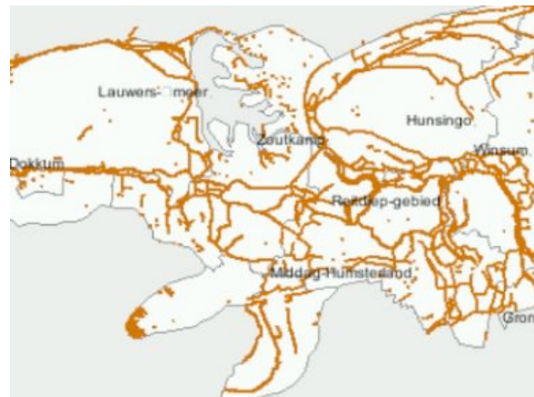
Dijken in het deelgebied Lauwers