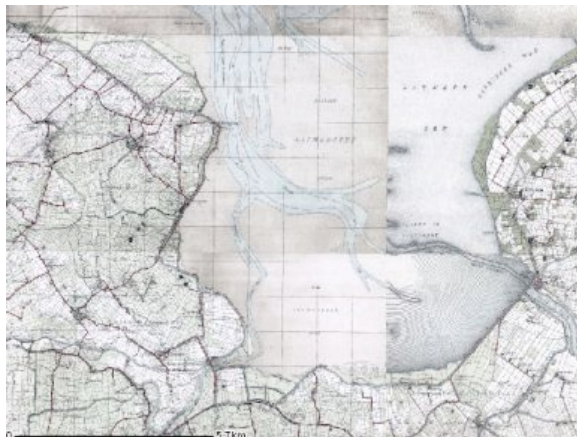
Oude kaart van de Lauwerszee

De rivier de Lauwers ontstond aan de noordzijde van het keileemplateau dat het Drents plateau genoemd wordt. Aan het einde van de laatste ijstijd werd het klimaat warmer en vochtiger, waardoor de ijskappen smolten en de zeespiegel steeg. De grondwaterspiegel steeg ook, waardoor evenwijdig aan de toenmalige kustlijn moerassen en veengronden ontstonden. Doordat de zeespiegel bleef stijgen, werd de veenvorming aan de zeezijde door het zoute water en door de afzetting van klei belemmerd, terwijl het veenmoeras zich landinwaarts steeds verder uitbreidde. In de Vroege Middeleeuwen drong de zee steeds dieper het land binnen en werden grote stukken veen weggeslagen. De monding van de Lauwers werd uitgeschuurd tot een breed estuarium: de Lauwerszee. Langs de rivieren werden kleiige wallen afgezet, die oeverwallen of kwelderwallen worden genoemd. Door daling van het achterliggende veengebied kwamen deze wallen relatief hoog te liggen. Op veel plaatsen zijn ze afgegraven ten behoeve van steenbakkerij. In gebieden waar het veen niet werd weggeslagen, zette zeelei zich af op het veen. Een deel van deze kwelders en klei-op-veengebieden is ingepolderd, waardoor de Lauwerszee kleiner is geworden. In 1969 werd de afsluitdijk aangelegd, wat het einde betekende voor deze zeeboezem.